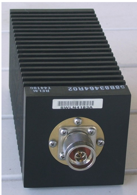
Abb. 1: Kunstantenne RELM T44100

Abmessungen: 70*70*160 mm (ohne Stecker) Gewicht: 1230 g Thermisch zulässige Verlustleistung: 100W Anschluß: N-Stecker